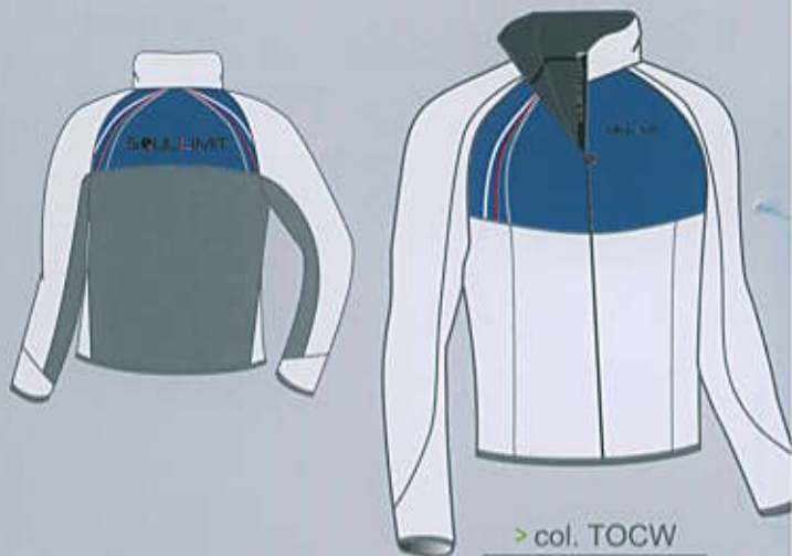
> col. TOCW

man / woman XS - M - L - XL - 2XL - 3XL - 4XL