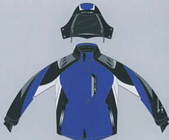
> col. BL-WB