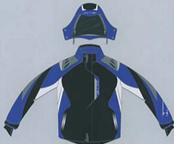
> col. B-WBL