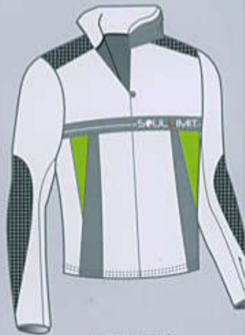
> col. WG