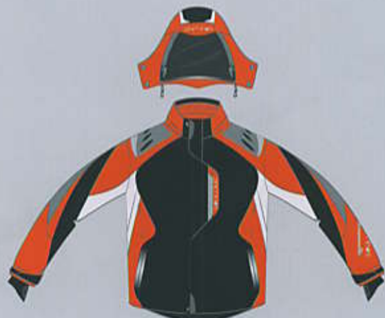
> col. B-WO