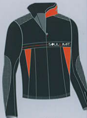
> col. BO