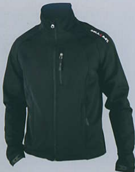
> MAKALU SA5

Softshell jacket in water-repellent fabric with windproof and breathable membrane and microfleece inside for the Paradiso model or waterproof breathable with microfiber inside for the Makalu model. Frontal pocket and technical pocket on the chest. The article is customizable with embroidery or, in the personal top version, with print too.