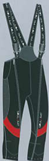
> col. BR