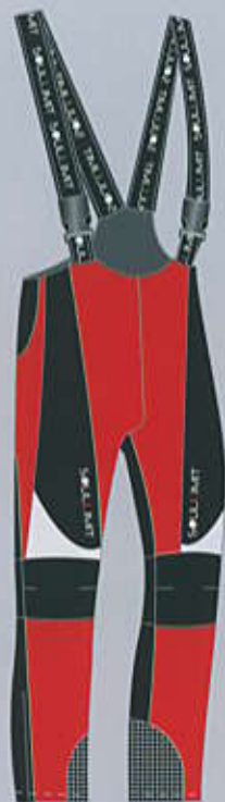
> col. RB