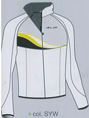
> col. SYW