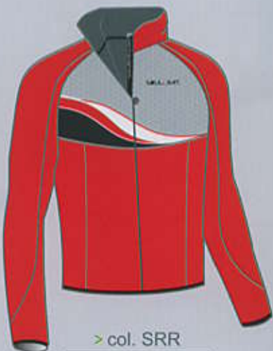
> col. SRR

IMPERMEABILITA' WATERPROOF and TRASPIRABILITA' BREATHABILITY Respira waterproof and windproof membrane