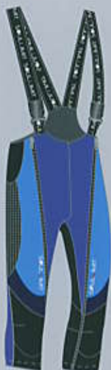
> col. BLBB