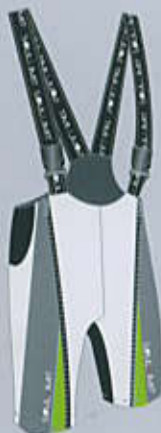
> col. WG