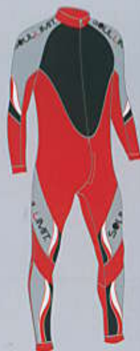
> col. S.RR