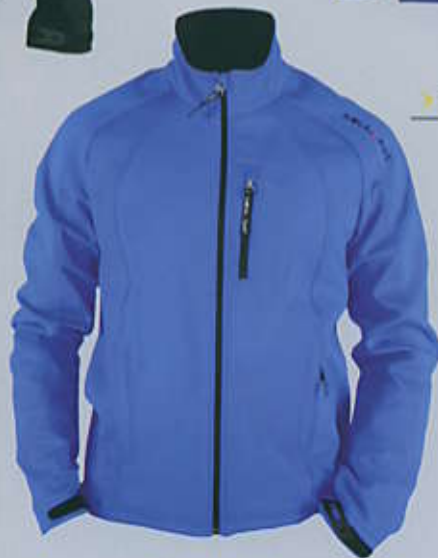
> PARADISO SA6

MATERIALE ESTERNO / EXTERNAL FABRIC Softshell