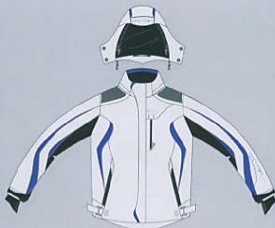
> col. W-BLB