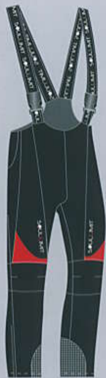
> col. BR