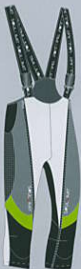
> col. WG