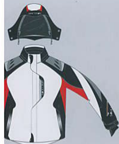
> col. W-RB