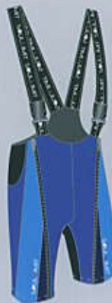
> col. BLBB