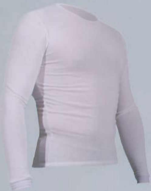
> SIT3 Maglia bambu