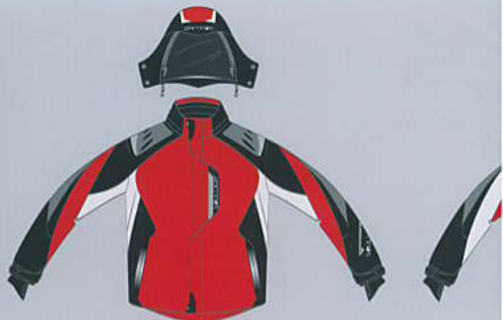
> col. R-WB

TAGLIE / SIZES baby 6 - 8 - 10 - 12 man / woman XS - S - M - L - XL - 2XL - 3XL