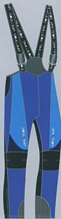
> col. BLBB