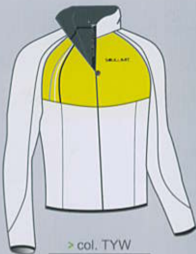
> col. TYW