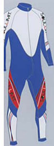
> col. T.WBL