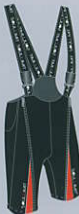
> col. BO