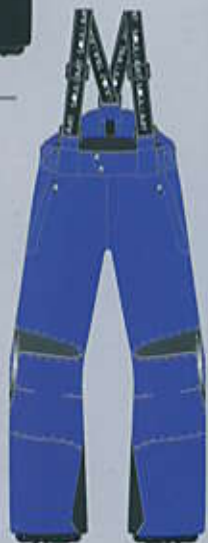
> col. BL