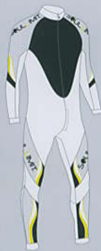
> col. S.YW