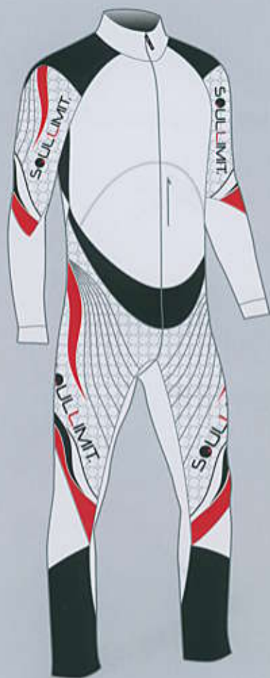
> col. W.GR