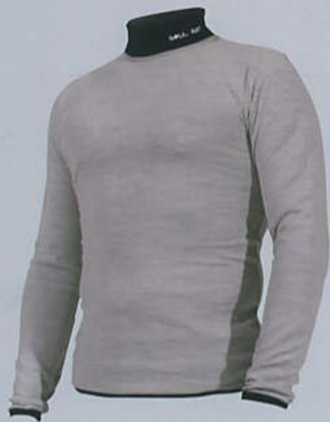
> SIT2A Maglia lana dora