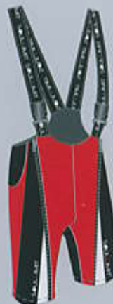
> col. RB