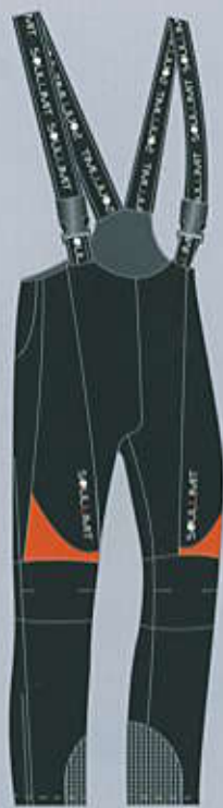
> col. BO