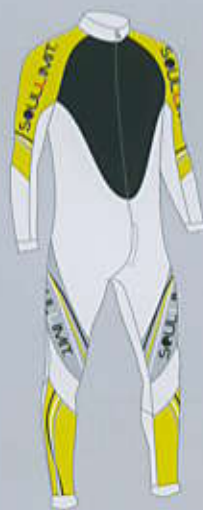
> col. T.YW