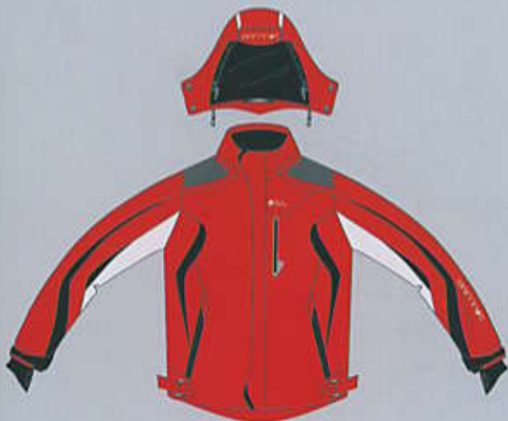
> col. R-WB