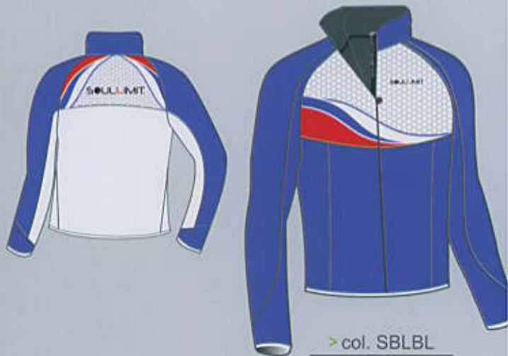
> col. SBLBL