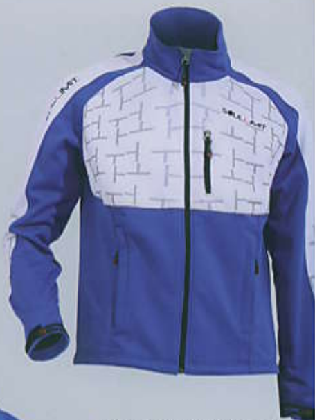
> PERSONALTOP SA3