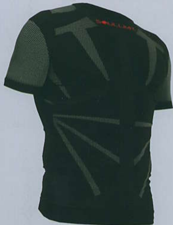
> SIT6B Maglia Carbon

TAGLIE SIZES man / woman XS - S - M - L - XL - 2XL