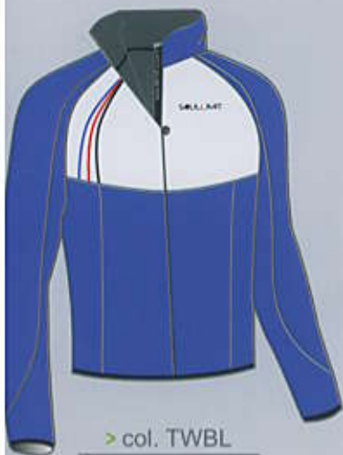
> col. TWBL

Cross-country technical vest, in elastic windproof breathable fabric with variable elasticity inserts on the front, and microfleece on the back. It has two hidden pockets on the front. Customizable article with print.