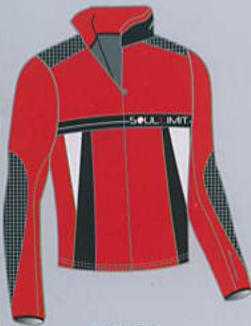
> col. RB