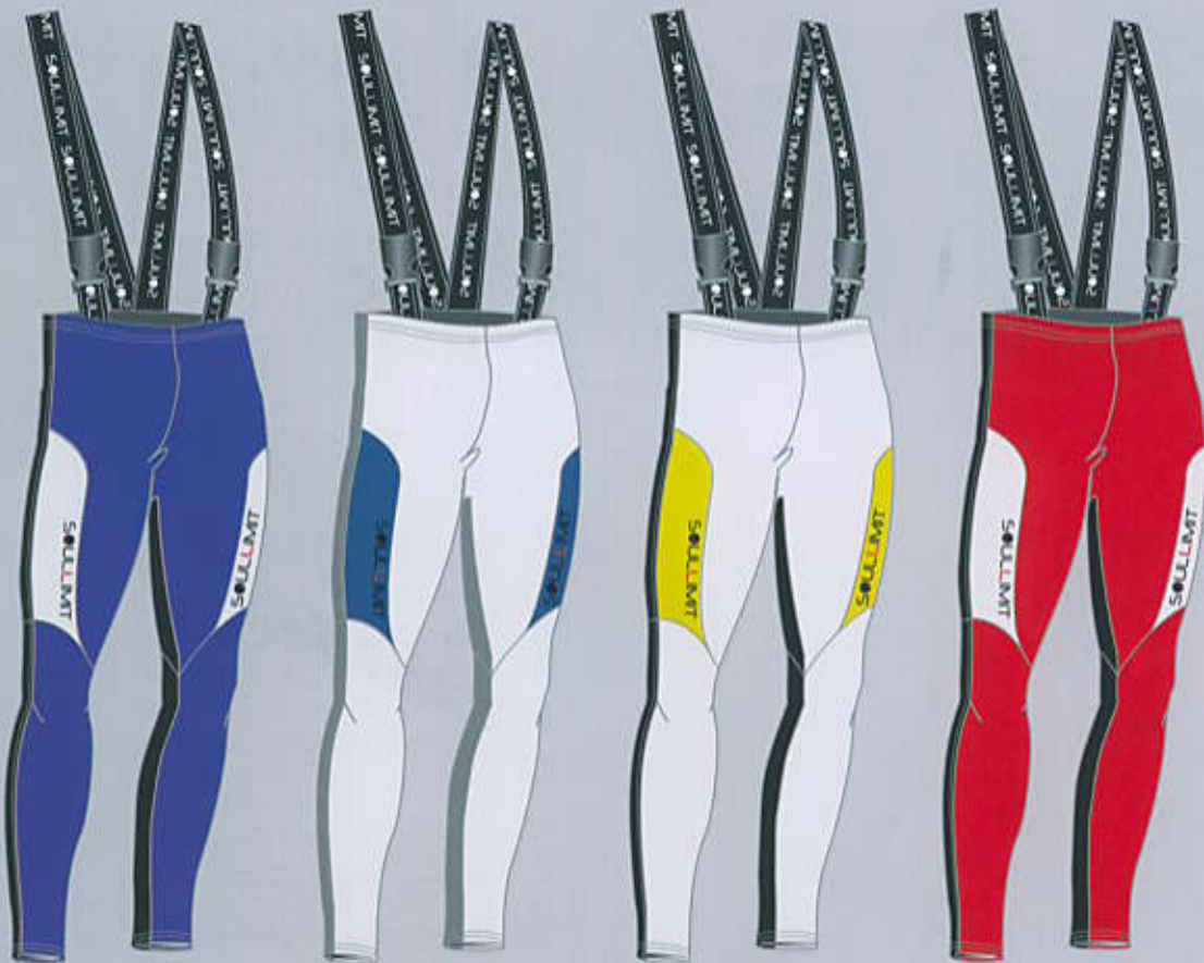
> col. WBL

TAGLIE SIZES baby 1-2-3 man / woman XS - M - L - XL - 2XL - 3XL - 4XL