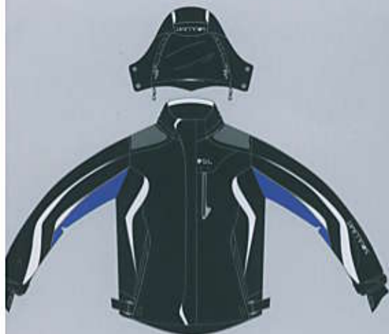
> col. B-BLW