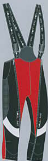
> col. RB