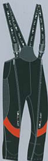
> col. BO