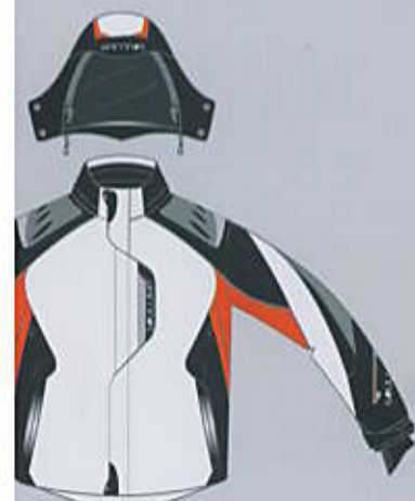
> col. W-OB