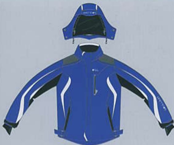
> col. BL-BW

TAGLIE SIZES baby 6 - 8 - 10 - 12 man / woman XS - S - M - L - XL - 2XL - 3XL