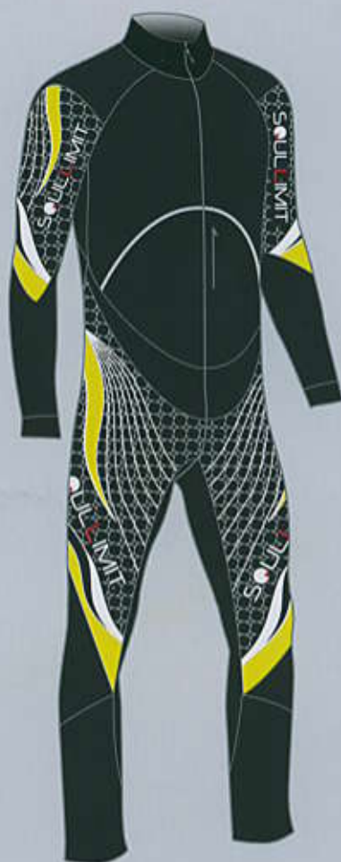
> col. B.BY