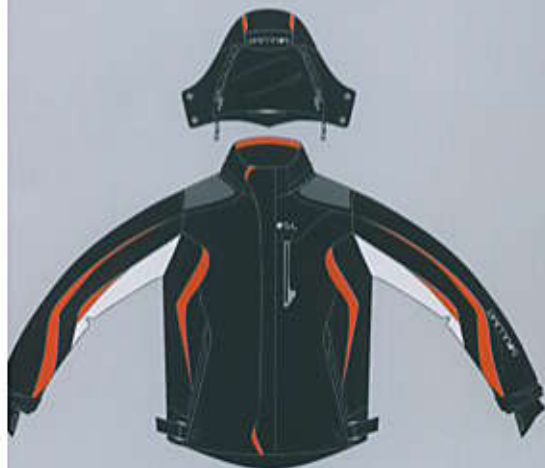
> col. B-WO