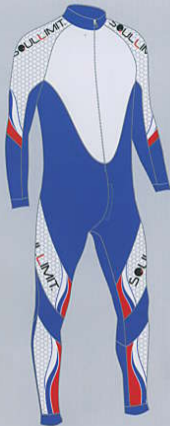
> col. S.BLBL