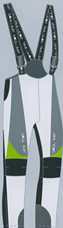
> col. WG