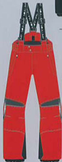
> col. R