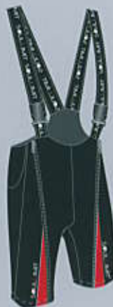
> col. BR

TAGLIE SIZES baby 1 - 2 - 3 man / woman XS - M - L - XL - 2XL - 3XL - 4XL