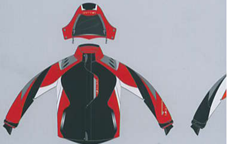
> col. B-WR