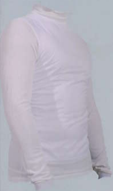
> SIT3AZ Maglia Zerowind