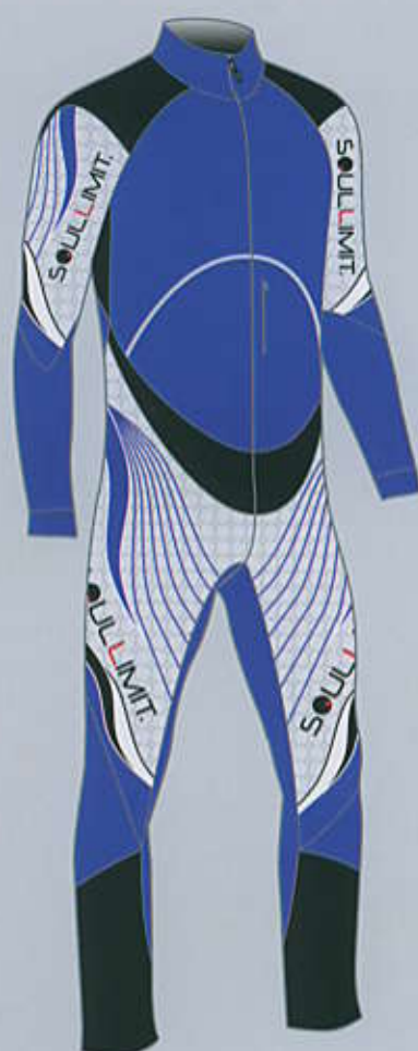
> col. BL.GBL