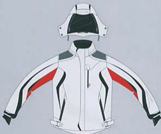
> col. W-RB