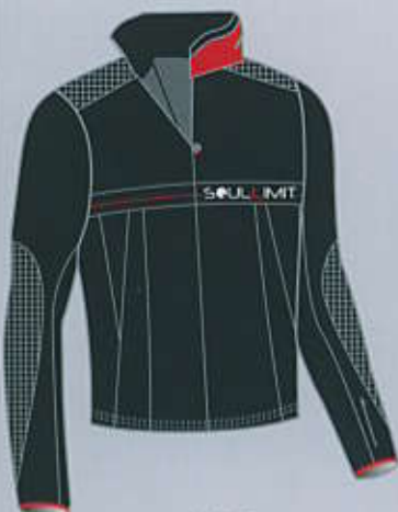
> col. BR

TAGLIE SIZES baby 1 - 2 - 3 man / woman XS - M - L - XL - 2XL - 3XL - 4XL