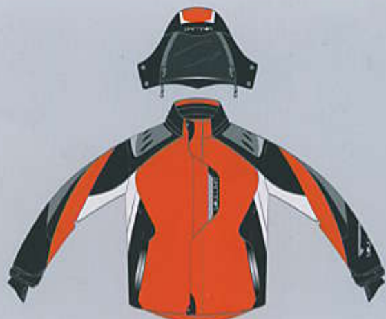
> col. O-WB