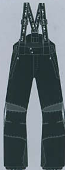
> col. B

TAGLIE SIZES baby 6 - 8 - 10 - 12 man / woman XS - S - M - L - XL - 2XL - 3XL